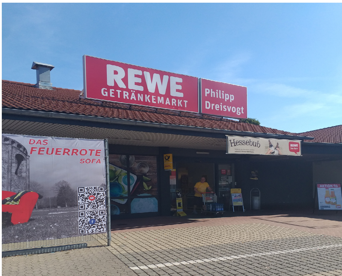
Foto1:Auf gleicher Anlage REWE Getränkemarkt